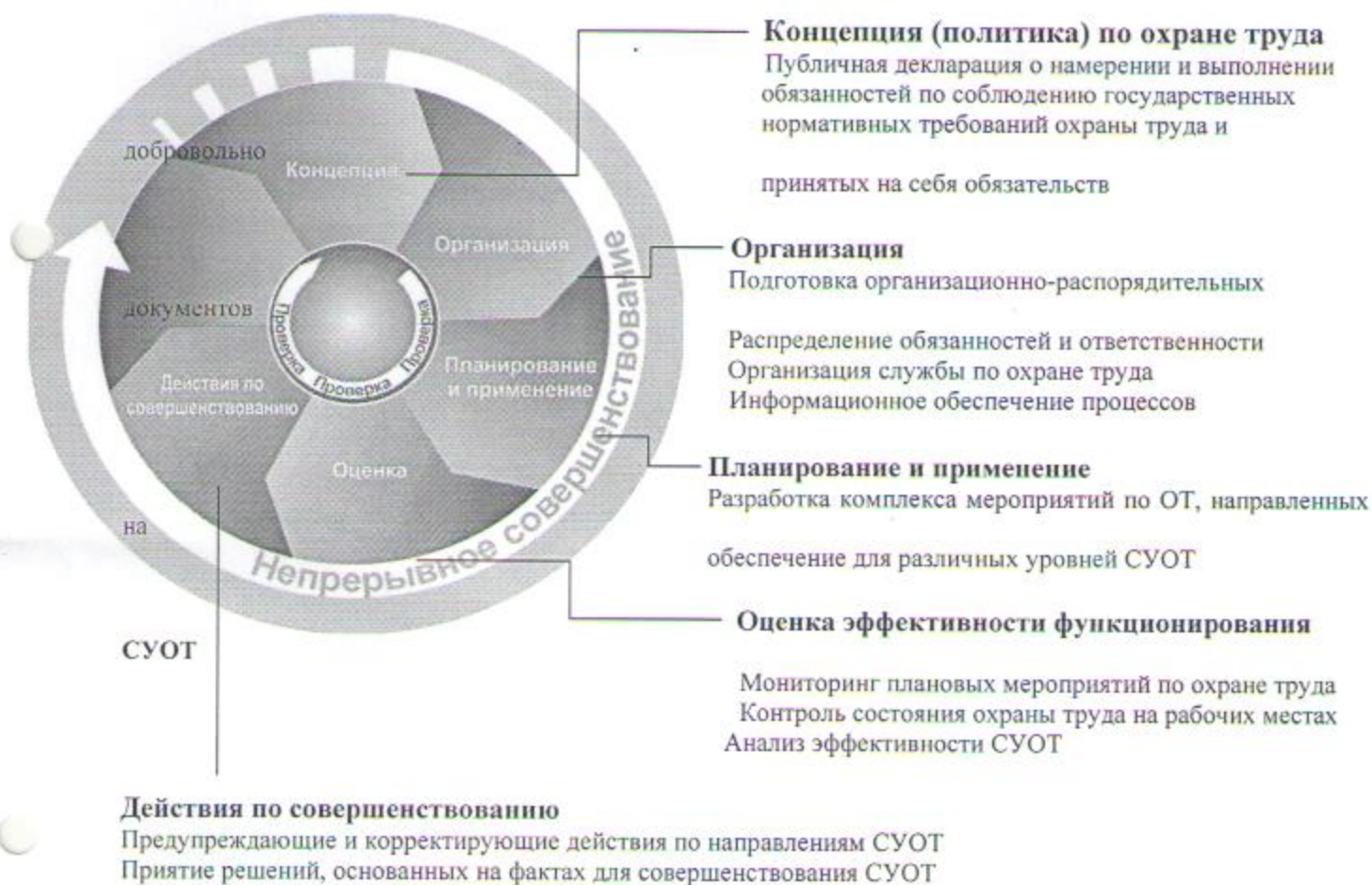
Рис.1. Основные элементы системы управления охраной труда

Основные элементы системы управления охраной труда представлены на рис.1